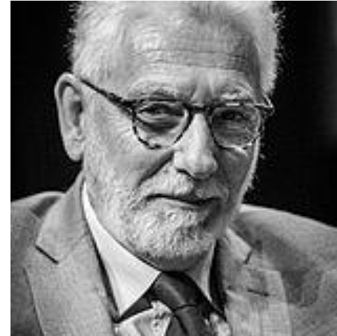
Philippe Descola Anthropologue de la nature