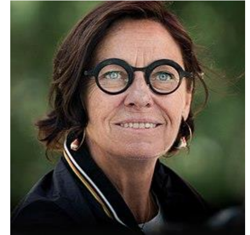
Vinciane Despret Psychologue et philosophe des sciences

Par «écologie» on entend alors à la fois l'étude (épistémique), l'attention (empirique) ou le soin (éthique) portés aux relations multiples qu'entretiennent les êtres vivants entre eux et leur environnement (physique, social et mental). Cette articulation de ces trois dimensions de l'environnement est explicite en France, dès les années 1980, avec les travaux de Félix Guattari (1989) et Gilles Deleuze (1980).