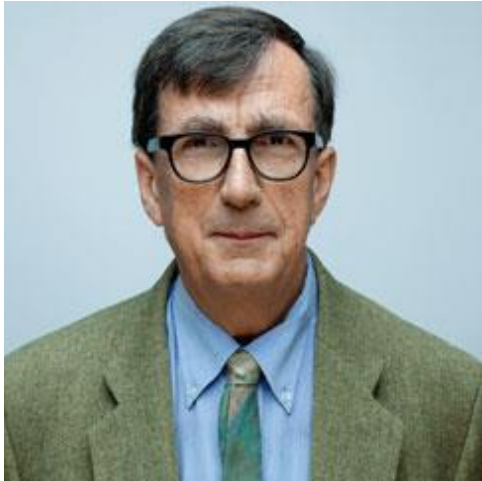
Bruno Latour Anthropologue et philosophe des techniques