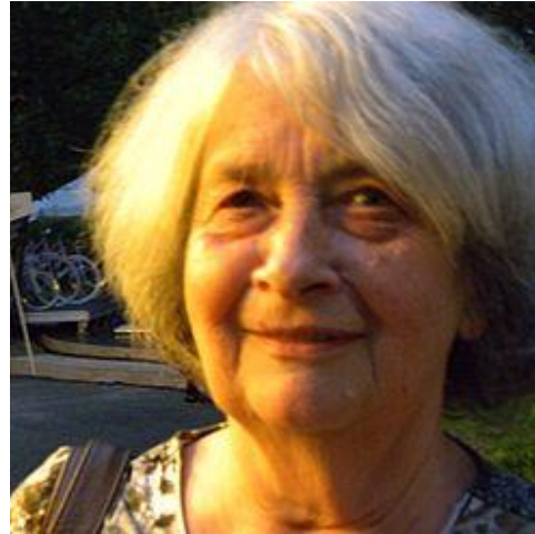
Isabelle Stenger Épistémologue et philosophe des sciences